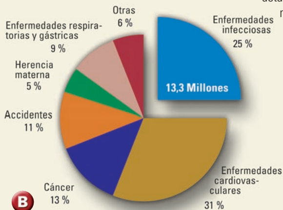
▲ Causas de los 53,9 millones de decesos en todo el mundo (Fuente: OMS, 1999).

→ En Europa es la afección transmitida por garrapatas más frecuente. Aproximadamente entre el 5 y 35% de las garrapatas están infectadas con borrelias. Según los estudios realizados hasta la fecha, después de ser picados por una garrapata, entre el 3 y el 6% de los afectados contrae una infección, en tanto que entre el 0,3 y el 1,4% contrae una enfermedad grave. En el caso de mordeduras