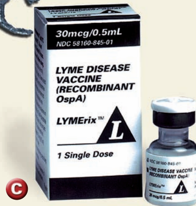
▲ La enfermedad de Lyme fue llamada así por la localidad que lleva el mismo nombre en el estado de Connecticut, EE.UU., donde se detectó la enfermedad. Por eso, la primera vacuna contra la borreliosis fue llamada LYMERix.